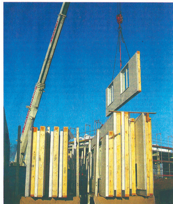
Der Aufbau geht dann schnell

Eine intelligente Planung, die viele kleine technische Mosaiksteinchen zugunsten einer autarken Energieversorgung zu einem nachhaltigen Ganzen vereint, erfordert einen höheren planerischen und damit finan-